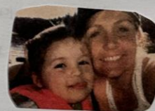
My beautiful mama and I fishing on a boat. 1